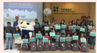
子どもたちとその家族