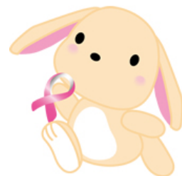
日本化薬グループピンクリボン活動 オリジナルキャラクター「Kayami」