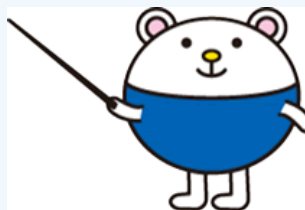
浸透キャラクター「かやくーま」

グローバルに展開している日本化薬グループのすべての従業員にKAYAKU spiritを親しみやすく身近に感じてもらうために、KAYAKU spirit 浸透キャラクター「かやくーま」を作成しました。社内報で、各種CSR活動や企業ビジョン実践の模範的な活動を紹介するコーナーを設けておりますが、「かやくーま」を用いてビジュアル的にわかりやすく説明するようにしています。また、日常使用するメモやクリアファイル、さらには会議室のデザインにも取り入れて、常に従業員の目に触れ、企業ビジョンを意識させるよう取り組んでいます。現在では、商標登録も行い、日本化薬グループのキャラクターとして、新聞広告や工場祭のノベルティ等でも活躍しています。