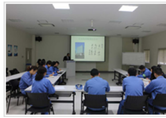
中国グループ会社での研修風景

日本化薬グループは、コンプライアンスの浸透と醸成を図るため、教育研修や職場ごとに独自の行動計画を策定し、職場での具体的な活動を実施しています。年度を通じた活動結果を評価したうえで、継続的な啓発に取り組んでいます。