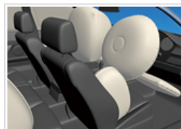
火薬の技術により作動するエアバッグ