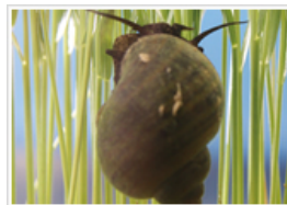
スクミリングガイ