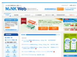
日本化薬 医療関係者向け情報サイト「MiNK Web」

※【IVR】「血管内治療」、「血管内手術」とも言われ、エックス線透視や超音波像、CTを見ながら体内に細い管（カテーテルや針）を入れて病気を治す治療法です。