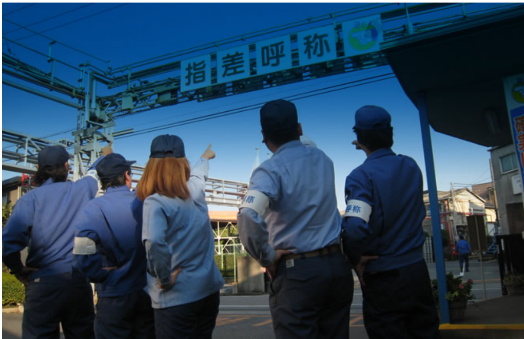
株式会社日本化薬東京での指差呼称