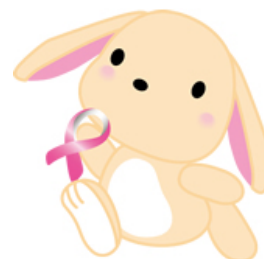
日本化薬グループピンクリボン活動オリジナルキャラクター「Kayami」