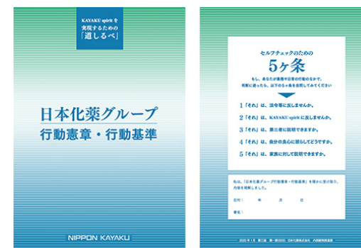
日本化薬グループの行動憲章・行動基準