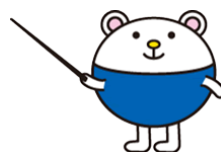
浸透キャラクター「かやくーま」