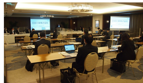
会場とリモートの併用で開催した2022年3月期決算の説明会

日本化薬グループは、四半期ごとに機関投資家・証券アナリストや各種メディアのみなさまを対象とした決算説明会を実施しています。コロナ禍の期間においては、電話会議や、会場とオンラインの併用などの方法で開催し、2022年3月期決算の説明会では役員執行役員全員が出席の上、通期決算や業績の見通し、新中期事業計画KAYAKU Vision 2025 (KV25)の方針について、説明と質疑応答を行いました。