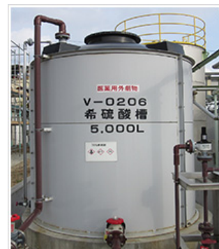
作業者がばく露するおそれのある化学物質の危険有害性を認識できるようしています

GHSの絵表示を化学物質の取り扱い場所に貼付して、作業者がばく露するおそれのある化学物質の危険有害性を認識できるようしています。