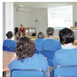
従業員への説明会

活動として、各部署の部会で従業員に説明しました。従業員の中には男性も乳がんにかかる可能性があることに驚く人もいました。