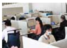
医薬品情報センター

また、医療施設を訪問する医薬情報担当者と連携し患者様のお役にたてる情報を提供するよう努めるとともに、お客様からのご要望やご意見を社内の担当部署に報告・提案しています。医薬品情報センターでは、「すべては適正使用の推進と顧客満足度の向上のために」をスローガンとし、より良い医療に貢献していきます。