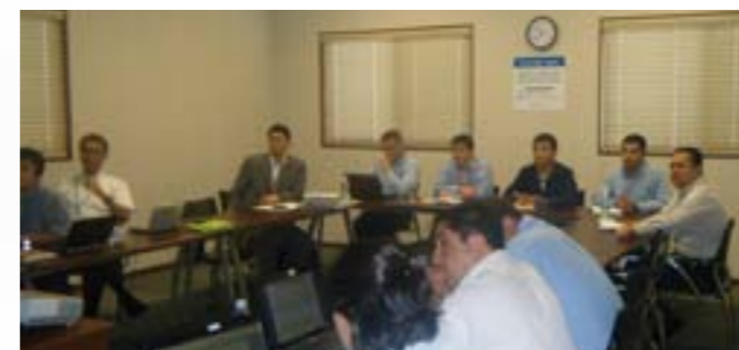
企業ビジョンの揭示

日本化薬グループの全従業員がCSR経営の意義を理解し、一体となって目標に向かえるように、経営幹部や各事業場の責任者からのCSR意識の浸透に加え、年間数十回のCSR研修・コンプライアンス研修を行っています。また、組織横断的なCSRプロジェクトを運営し、全事業部門・各管理部門がCSR活動に参画できるような仕組みを採用しています。企業ビジョンやCSR経営を説明した冊子や携帯用カードは、グループ会社の公用語である6カ国語に翻訳し、全グループで共有するように努めるとともに、優秀な取り組みについては全グループで共有するようにしています。