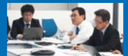
※【BCP】Business Continuity Plan (事業継続計画)

の対応レベルが高いと評価されました。今後、日本化薬のグループ会社BCPマニュアル作成の支援を行い、グループ全体での体制強化に努めていく予定です。