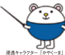
浸透キャラクター「かやくーま」

リアファイル、さらには会議室のデザインにも取り入れて、常に従業員の目に触れ、企業ビジョンを意識させるよう取り組んでいます。現在では、商標登録も行った、日本化薬グループのキャラクターとして、新聞広告や工場祭のノベルティ等でも活躍しています。