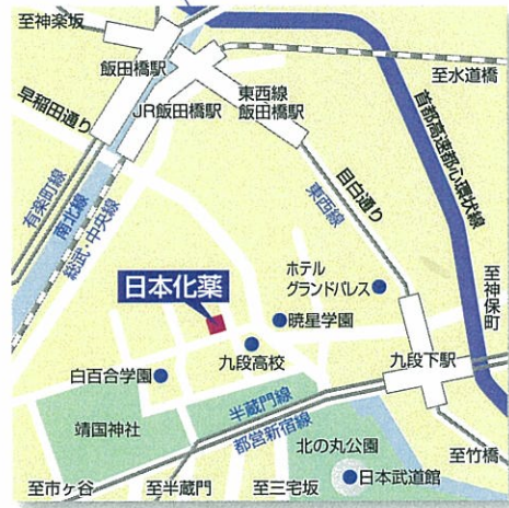
医薬事業本部 原薬・国際営業部